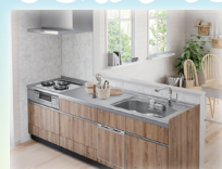
キッチン・給湯器