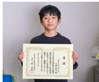
「なんで巻きつく?アサガオの研究⑤ ~つると支柱の太さの関係~」

庭の木に産み付けられたチョウの卵をきっかけに研究を始めました。図鑑やインターネットで調べながらナミアゲハの成長を観察し、色使いや図を入れるなど工夫してまとめました。今後チョウの研究を続けたいです。