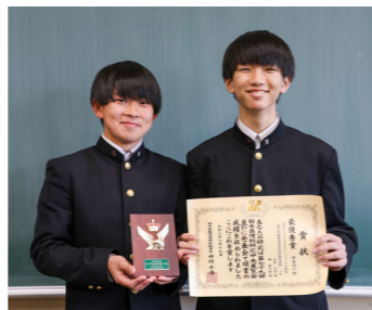
「空力パーツによるダウンフォースの研究」

1年生からアサガオの研究を続けています。毎日決まった時間に観察し、変化を記録しながら研究を進めました。比較実験のため、アサガオ15株を管理するのに苦労しました。来年はさらに研究を深めていきたいです。