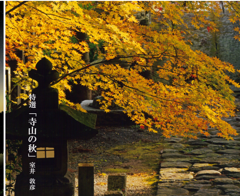
特選「寺山の秋」室井 敦彦