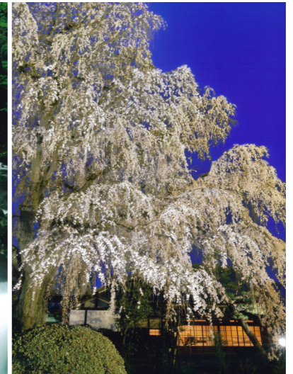
佳作「宵闇を彩る」 舟橋 哲次