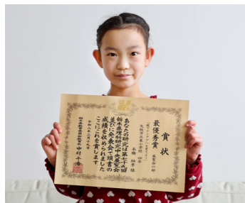
「庭でナミアゲハを育てよう」