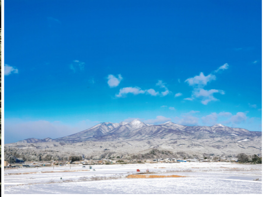
佳作「雪原の朝、高原山」 ファウラー ジョージ