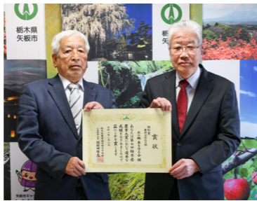
農村活性化の部 特別賞 水の郷 泉を守る会 様

新たな発想による取組を行う農業者・団体を表彰するものです。受賞者の皆さんは、それぞれの分野で先進的かつ意欲的な活動を続け、その功績が高く評価されたことを報告しました。