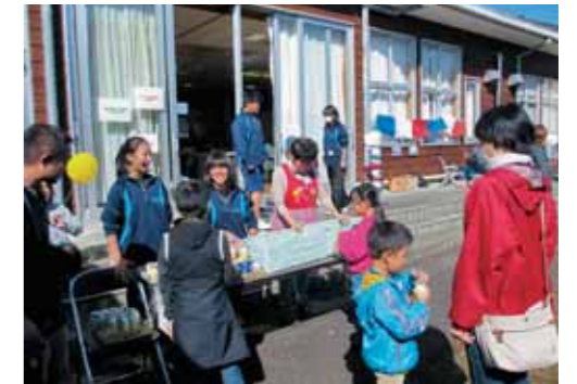
▲泉中のボランティアも大活躍です。

今年にご来場いただいた皆さんにアンケートのご協力をいただきました。結果の一部をご紹介します。