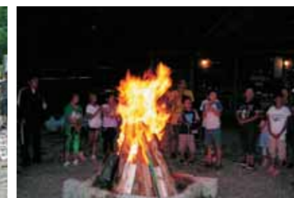
▲キャンプファイヤー