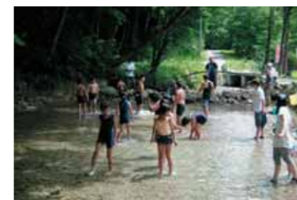
▲マスのつかみ取り

○天王祭 幸岡公民館にて、天王祭を開催しました。地域のたくさんの方が参加し、地域の大人と子どもが交流を図ることができました。