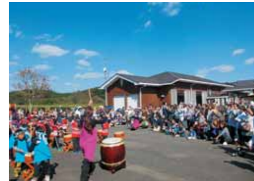
▲たくさんの方にご来場いただきました。

台風の影響が心配されましたが、当日はやや強い風が吹いたものの、台風一過で晴天に恵まれ、青空に太鼓の音や子どもたちの声が響きわたりました。