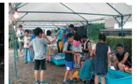
▲天王祭にたくさんのお子どもたちが参加!

募集 心の教育推進事業は、平成26年度~29年度に実施する地区を募集しています。詳しくは、生涯学習課(☎(43)6218)までお問い合わせください。