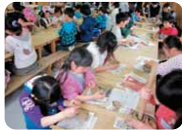
毎年、たくさんのお子どもたちが参加してくれます

期 日／6月3日(日) ※16:00終了予定 雨天決行 場 所／県民の森・星ふる学校くまの木 内 容／尚仁沢湧水ハイキング・コースターづくり 集 合／市生涯学習館 9:00 ※市バスで移動します 対象・定員／市内在住の小学2年生から中学3年生 50人 (全国子ども会安全共済会に加入していること)