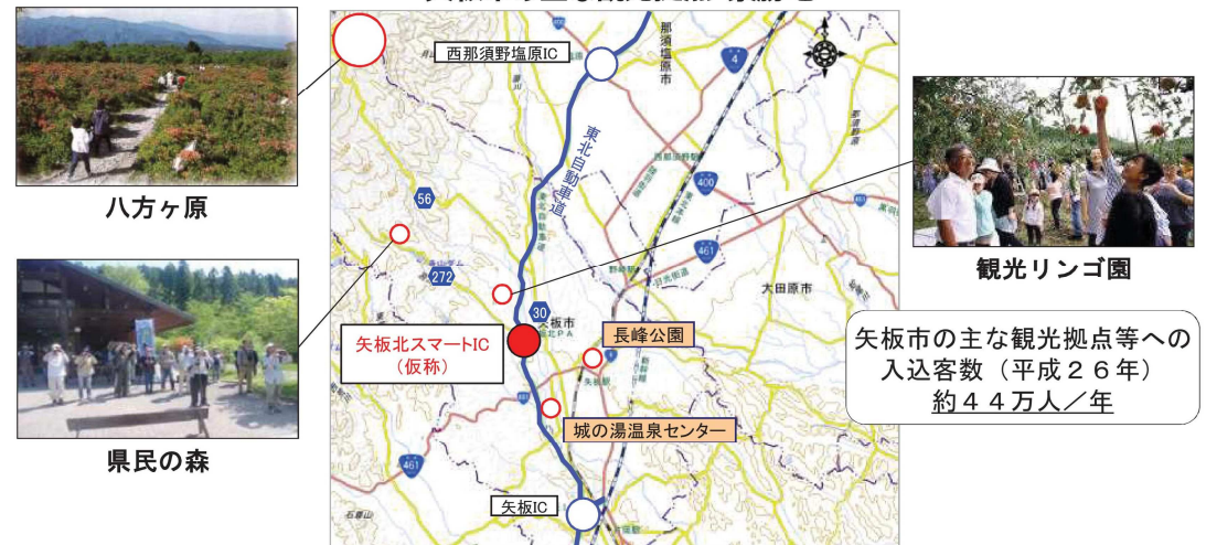
矢板市の主な観光拠点・景勝地