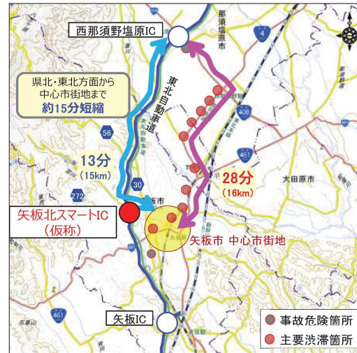
県北・東北方面(西那須野塩原IC)からの所要時間