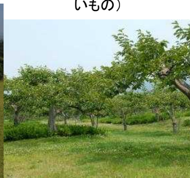
植生自然度3(果樹園) 耕作地(樹園地)