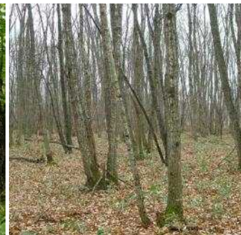
植生自然度7(コナラ二 次林)二次林