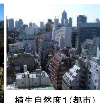
植生自然度1(都市) 市街地・造成地等