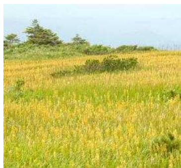
植生自然度10(湿原) 自然草原