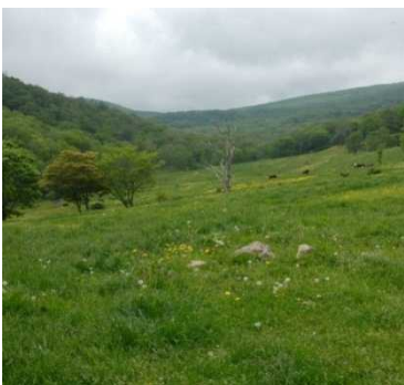
植生自然度5(草原) 二次草原(背の高い草 原)