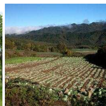
植生自然度2(畑) 農耕地(水田・畑)、緑 の多い住宅地等