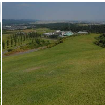
植生自然度4(シバ草 原)二次草原(背の低い 草原)