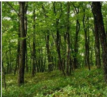
植生自然度8(ミズナラ二 次林)二次林(自然林に近 いもの)