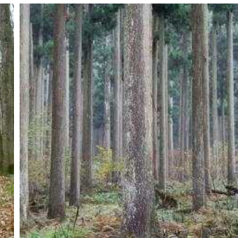
植生自然度6(カラマ ツ人工林)植林地