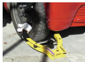
自動車などを差押えるときはタイヤをロックします。

納期限までに税金が納められていないときは、督促状が発表されます。発表の日から起算して10日を経過した日までに完納されないと、預貯金・保険・給与・土地・建物・自動車・オートバイの差押えなどの滞納処分を受けることになります。