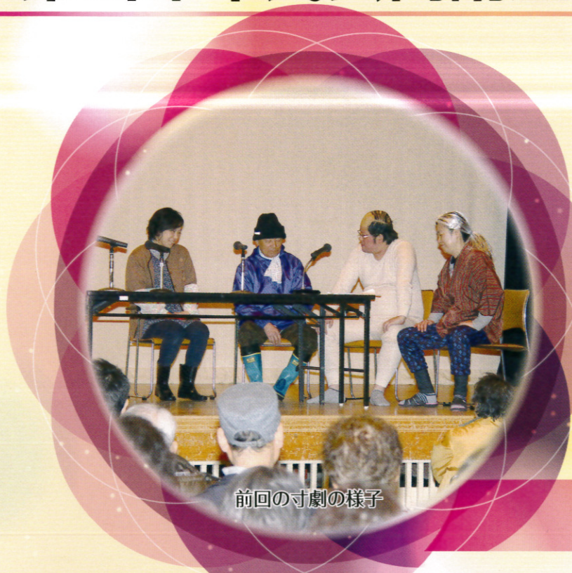
前回の寸劇の様子

介護保険制度について、寸劇を通して解りやすく市民の皆様にお伝えする機会を設けました。近所の方々お誘い合わせのうえ、ぜひご参加ください。