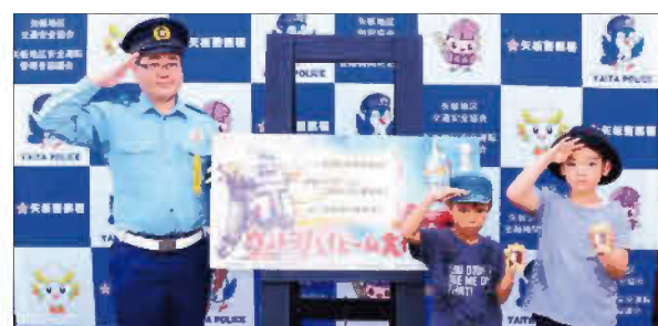
※現在、反射材キーホルダーの配布は終了しています。

問い合わせ／ 暮らし安全環境課危機対策班 ☎(43)1114 矢板警察署 ☎(43)0110