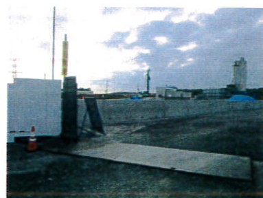
JA全農とちぎの工事現場