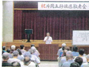
片岡5行政区敬老会にて (R1.9.15)