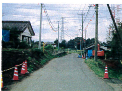
市道木幡安沢1号線の道路改良工事