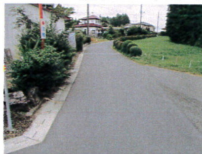
越畑地内の舗装修繕工事