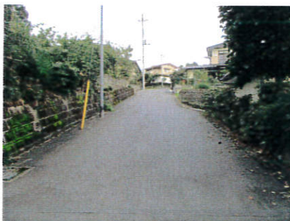
梶ヶ沢地内の舗装修繕工事