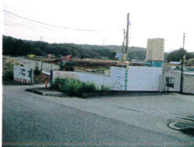
三上化学製鎖の工事現場