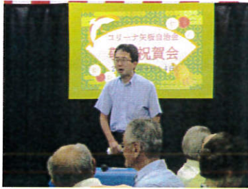
コロナ対策委員会にて (R1.9.14)

今後とも「未来づくり懇談会」等でお寄せいただいたご意見やご提案、ご要望をしっかりと受け止め、本格的な人口減少・少子高齢社会に即したまちづくりに努めてまいりますので、行政区長の皆様の一層のご理解とご協力を賜りますよう、切にお願い申し上げます。