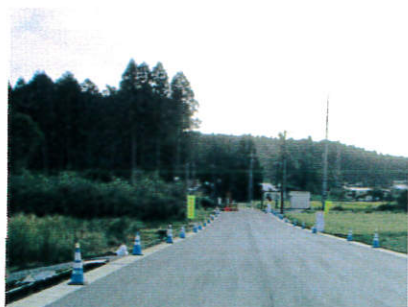
市道前岡1号線の道路改良工事