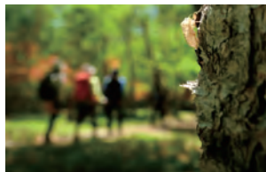
前回の特選作品「初夏」