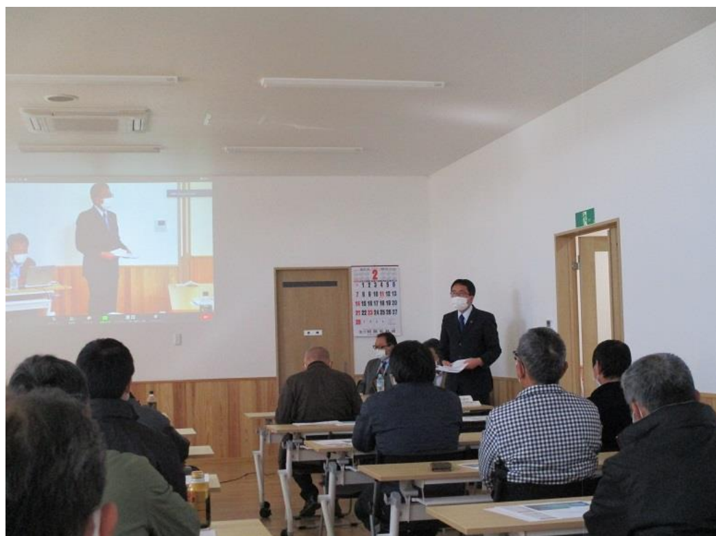
会長（市長）あいさつ