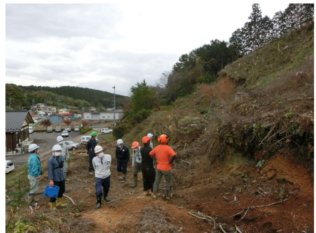
たかはら森林組合の現場視察