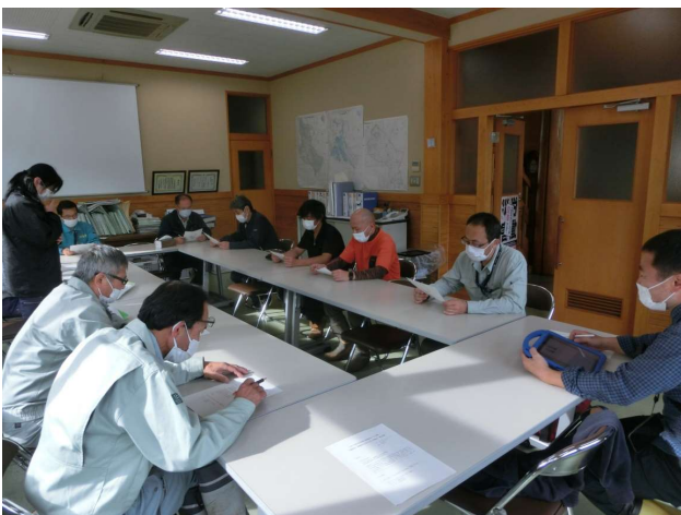
たかはら森林組合の視察