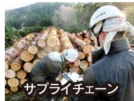
サプライチェーン

内容: ①伐期を迎えている人工林について、主伐・再造林を積極的に取り組み、持続的な林業活動の基盤を築く ②伐採された丸太を製材工場が受け入れる体制について、川上、川中双方の安定した経営環境を実現する