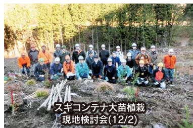
スギコンテナ大苗植栽 現地検討会(12/2)