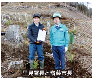
里見署長と齋藤市長

協定者: 塩那森林管理署、矢板市林業・木材産業成長化推進協議会 内容: 国有林をフィールドとした低コスト育林技術の実証、現地検討会等による低コスト育林技術の普及